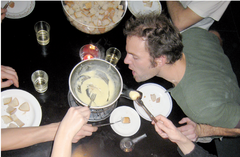
Fonduegelage im Minimum Boulderclub

Bei den meisten Ausdauerdisziplinen steigt der Umsatz täglich nicht über 3000 kcal respektive 4000 kcal. Allerdings konnten Spitzenwerte von 9000 kcal bei Tour de France Fahrern und bis zu 13000 kcal bei Ultraausdauerrennen wie 1000 km Läufen festgestellt werden. Bei Wettkampfsportkletterern liegt die tägliche Energieaufnahme jedoch lediglich bei ca. 2000 kcal bei Frauen, respektive 2700 kcal bei Männern. So liegt die direkt gemessene Sauerstoffaufnahme (entspricht dem Energieverbrauch) während des Kletterns in etwa im Bereich von lockerem Jogging. Bei Sportarten, welche eine ähnliche körperliche Konstitution wie Kletterer aufweisen (Kraftsportart bei niedrigem Körpergewicht: Turnen, Ringen, Judo, Tanzen), liegt der tägliche Energieverbrauch ebenfalls sehr tief bei bis hinab zu 1500 kcal bei Frauen und 2600 kcal bei Männern.